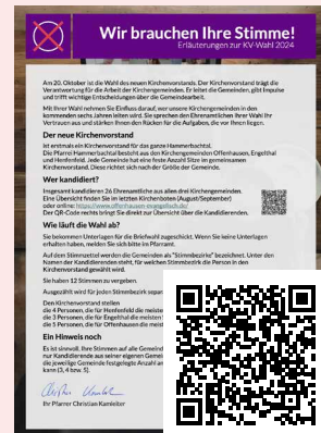
Infoblatt zur Wahl